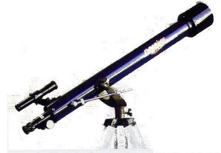
Doc. 4. Lunette astronomique \varnothing 60/800 mm (diamètre et focale) livrée avec 3 oculaires. Grossissements de 40x, 64x et 133x.